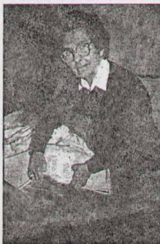
Специјални душек као годишња заштитна

мљиног магнетизма. И постеља старе госпође добила је неку врсту изолационог душека који се ставља испод обичног. На тај начин степен електромагнетног зрачења сведен је у њеној спаваћој соби на свега један проценат од пређашњег.”